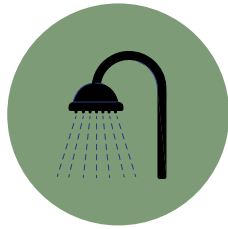
Moho y Hongos