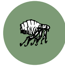
Ácaros del Polvo